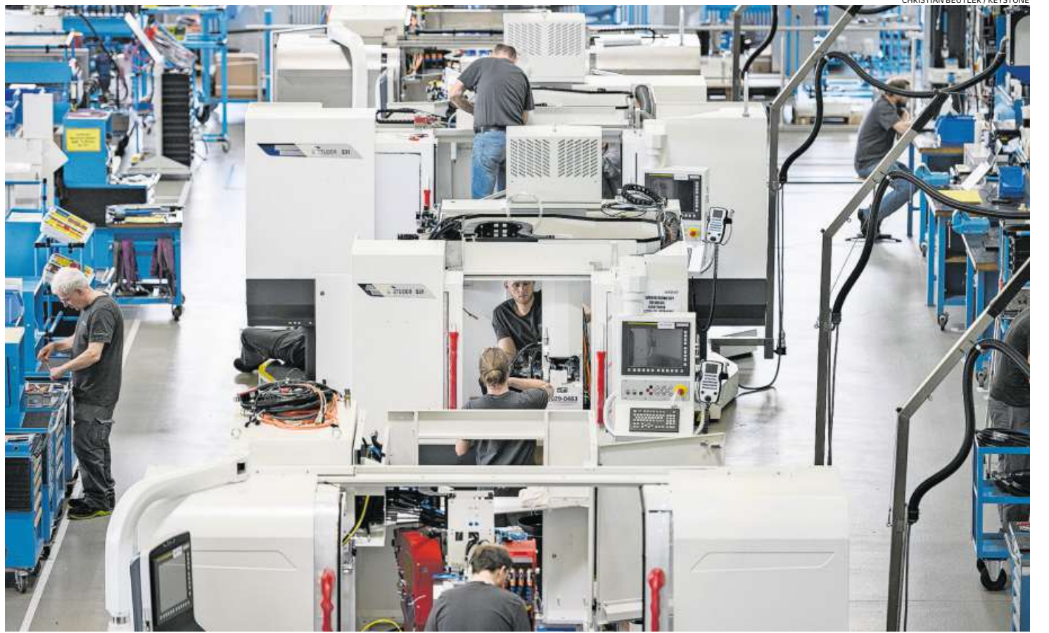
Belastete Gerechtigkeit zwischen den Generationen: Jüngere Angestellte zahlen oft Tausende Franken für die Renten der Pensionierten.

«Heute weisen die Kassen diese Geldflüsse nicht aus», er-